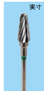
直径が 060と ワイドな 代替品 です 194 215 060