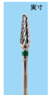
同サイズ・形状の クロスカット です (完売品は シングルカット) 194 220 050